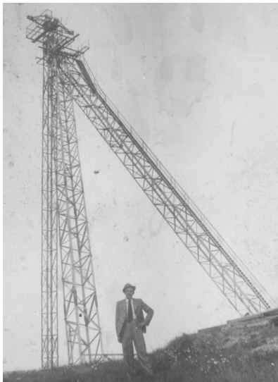
Kabelový jeřáb na Holých

Říšská průchozí dálnice Vídeň - Vratislav, projekt Čtyřmostí V lokalitě Krkaté báby měla vést trasa říšské průchozí dálnice Vídeň – Breslau (dnešní polská Vratislav). Kvůli uchování skalního útvaru "Krkatá bába" bylo navrženo, aby byly vozovky pro jednotlivé jízdní směry vedeny odděleně a přes dvě blízká údolí vybudovány čtyři samostatné mosty. Skalní útvar "Krkatá bába" se měl nacházet uprostřed mezi mosty.